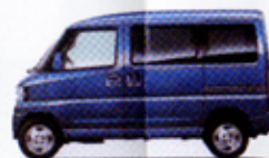
ミディアムブルーマイカ <FA>