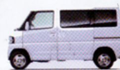
ホワイトソリッド <GE>

●ボディカラーは印刷インキの性質上、実際の色と異なって見えることがあります。ご購入の際は、実車・カラーサンプル等によってご確認ください。