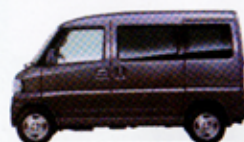
ドーンシルバーメタリック <DS>