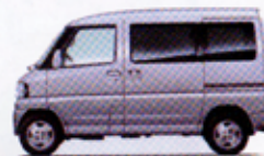
クールシルバーメタリック <QL>